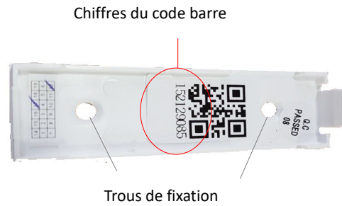
Chiffres du code barre